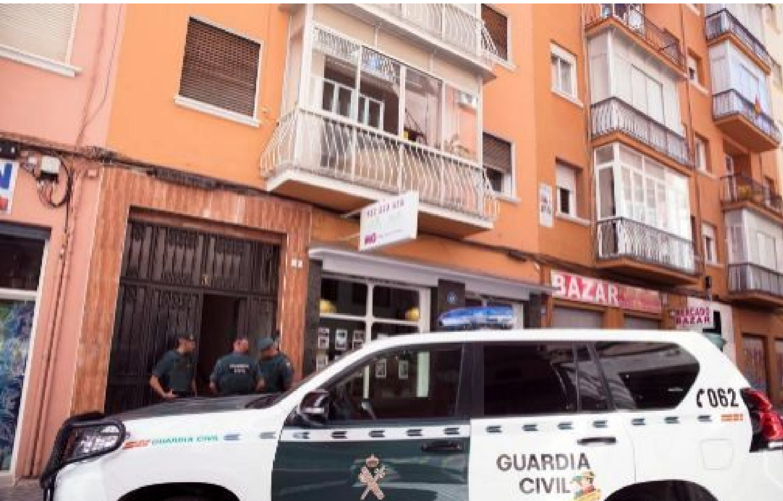
Agentes de la Guardia Civil, en una imagen reciente.

Pone de manifiesto que habitualmente no se respetan los descansos de 11 horas que como norma establece el reglamento del cuerpo. Salvo en excepciones, hay que respetar esos turnos, dice el juez