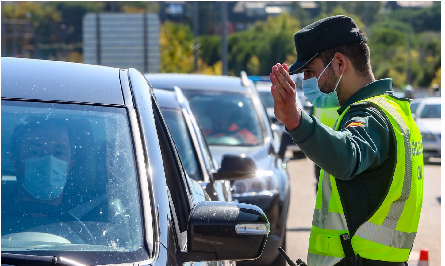
Un agente de la Guardia Civil da el alto a un vehículo durante un control a la salida de Madrid, el pasado día 10.

Para ser guardia civil conviene hablar inglés. Pero no hace falta que lo acredite la Escuela Oficial de Idiomas. Basta con tener un certificado homologado internacionalmente como el IELTS (International English Language Testing System) expedido por una institución tan prestigiosa como el instituto público británico British Council.