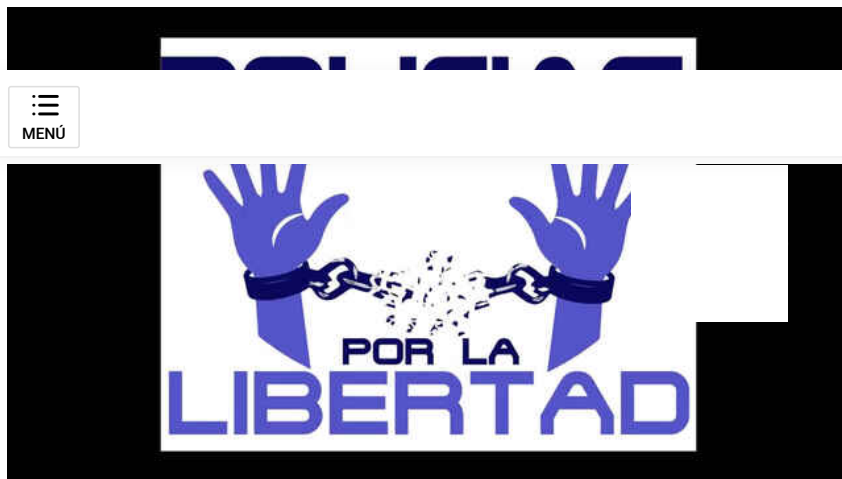
Manifestación de policías negacionistas antimascarillas.