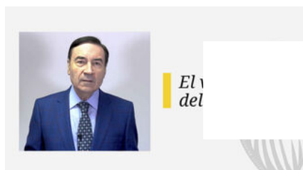
Videoblog del Director - Pablo Iglesias: para...