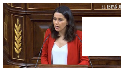
encontronazo que ha tenido Arrimadas con el...