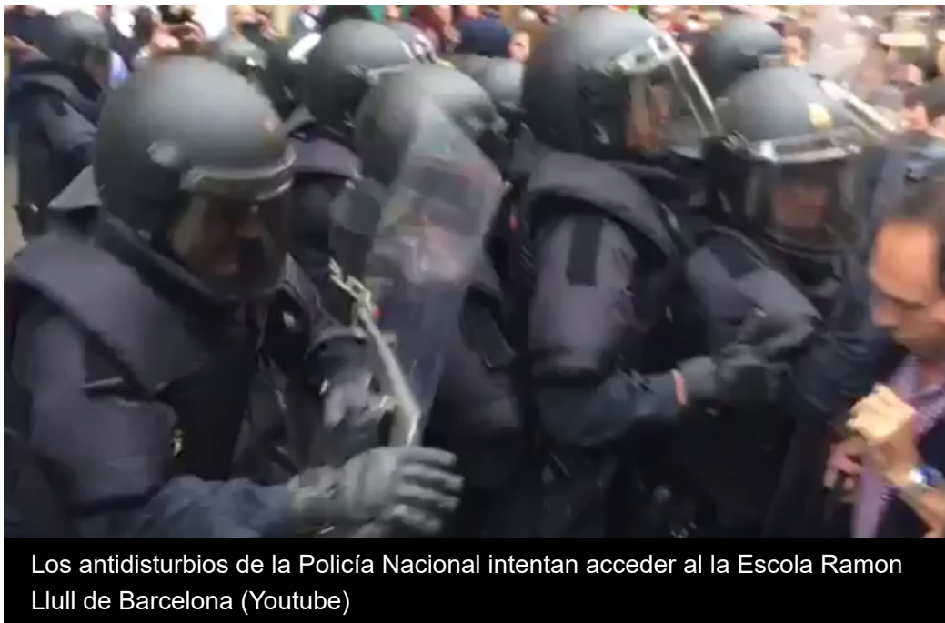
Los antidisturbios de la Policía Nacional intentan acceder al la Escola Ramon Llull de Barcelona (Youtube)

Catalunya: El juicio al 'procés', testimonio de la Guardia Civil, en directo