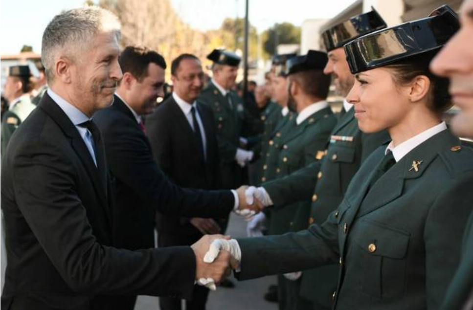
Marlaska, saluda a una agente en la inauguración de un Cuartel de la Guardia Civil la semana pasada.

"La eliminación total de este último requiere entre dos y tres sesiones más", que se darían en 30 o 40 días, anuncia la especialista, que explica que quitar totalmente el dibujo sin que quede marca ni cicatriz más o menos rápido depende de si la zona en la que está se encuentra cerca de ganglios linfáticos, como es el caso de la muñeca o los tobillos que, por este motivo, requiere "más tiempo". "Cuello, axilas o ingles necesitan menos tiempo para su eliminación", explica. Además, añade, "no todos los tatuajes se borran del mismo modo", influye el tipo de tinta, la técnica utilizada e incluso el tiempo transcurrido desde que se hizo. También es más fácil, agrega, "eliminar trazos sencillos como los que forman una palabra que dibujos con relleno".