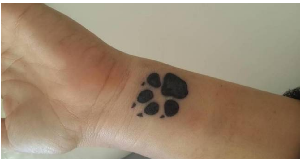
Imagen del dibujo antes de comenzar el tratamiento de borrado por láser.

El alto mando de la Guardia Civil aseguró también, tras el razonamiento esgrimido por la recurrente de que se estaba sometiendo a un tratamiento de eliminación del dibujo sobre la piel, que "el Tribunal de Selección constató la existencia de un tatuaje que incumplía las bases de la convocatoria, con independencia del estado en el que se encuentre tras el proceso de retirada". El letrado de la aspirante a formar parte del cuerpo que ha vuelto a recurrir esta decisión califica como "vergonzoso y mezquino que se considere que el minúsculo tatuaje medio borrado de esta chica afecta negativamente a la imagen de la institución cuando el ministro del Interior, Fernando Grande-Marlaska, tiene el brazo tatuado".