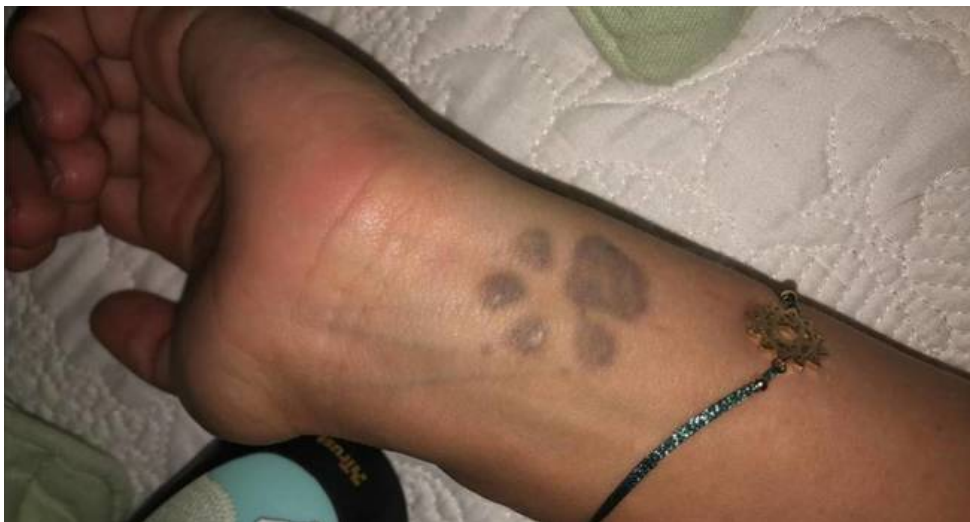
El tatuaje ya está casi borrado, pero la Dirección General niega el acceso a la aspirante. (EC)

La Dirección General de la institución argumentó que la aspirante no podía acceder al cuerpo con ese dibujo porque es un elemento prohibido para quienes pretenden entrar en la Guardia Civil. No así para quienes ya están dentro, que aún pueden portarlo porque no está regulado para ellos. El Ministerio del Interior arguyó que las bases de la convocatoria así lo decían expresamente. "Carecer de tatuajes que contengan expresiones o imágenes contrarias a los valores constitucionales, autoridades o virtudes militares, que supongan desdoro para el uniforme, que puedan atentar contra la disciplina o la imagen de la Guardia Civil en cualquiera de sus formas, que reflejen motivos obscenos o inciten a discriminaciones de tipo sexual, racial, étnico o religioso", reza el texto de la convocatoria al que apeló la resolución emitida por el general jefe de Enseñanza el pasado noviembre para rechazar el recurso de R. M. L.