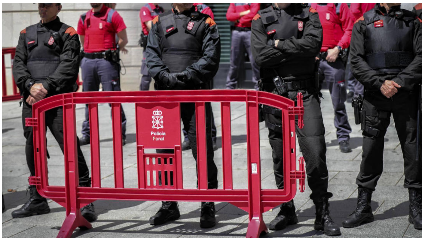
Agentes de la Policía Foral frente al Palacio de Justicia de Pamplona el pasado abril. CLAUDIO ÁLVAREZ

¿Puede ser condenada una madre por alertar a su marido de la presencia de un pederasta en el colegio de la hija de ambos? ¿Debe una agente local perder su empleo por avisar a un policía nacional de que un varón con antecedentes por corrupción de menores ha intentado llevarse a un escolar a su casa?