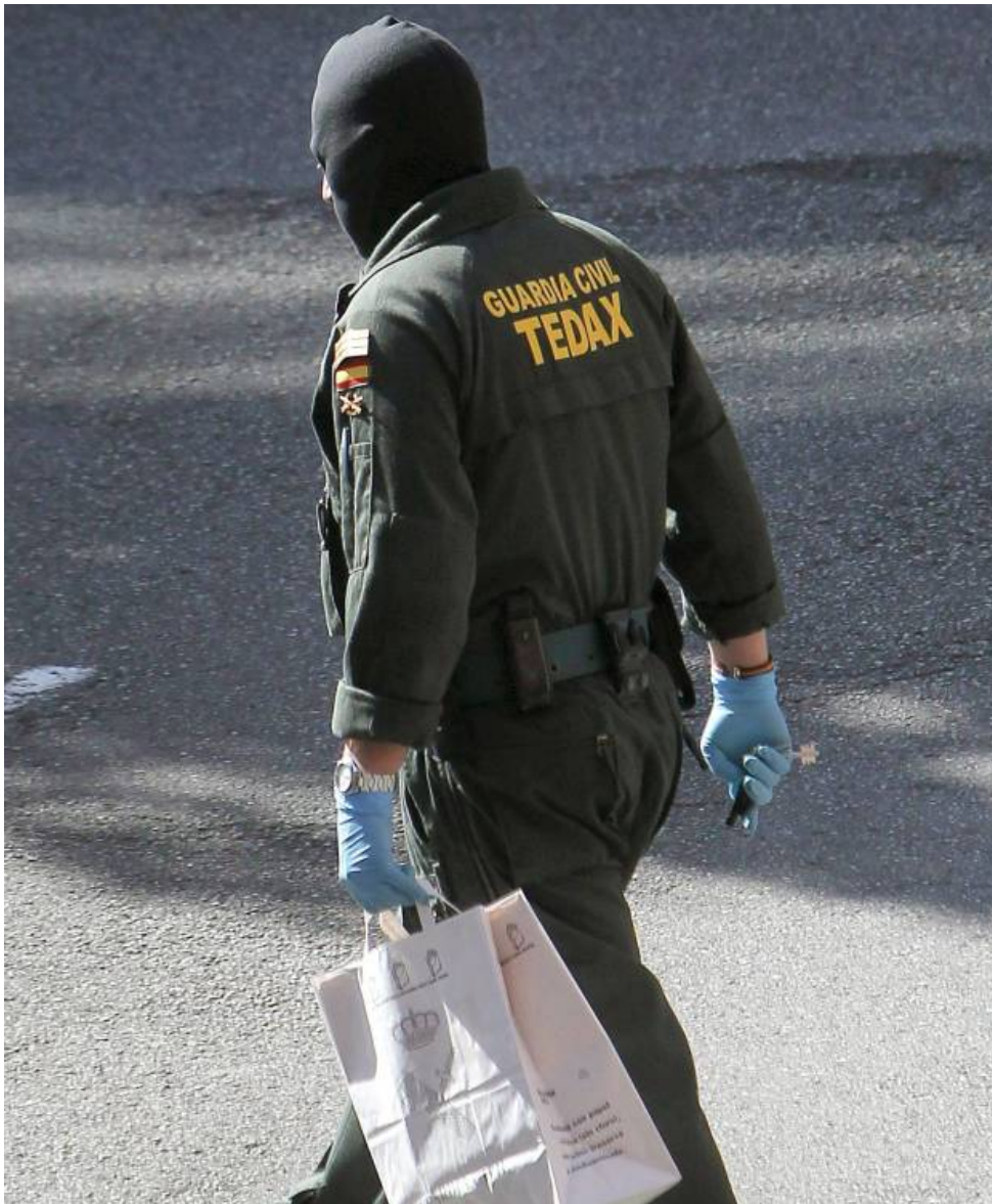
Especialista de los Tedax de la Guardia Civil.

El guardia civil sufrió una crisis de ansiedad durante un curso, 17 años después del atentado, en el que le pusieron la grabación del fatídico episodio que le cambiaría la vida