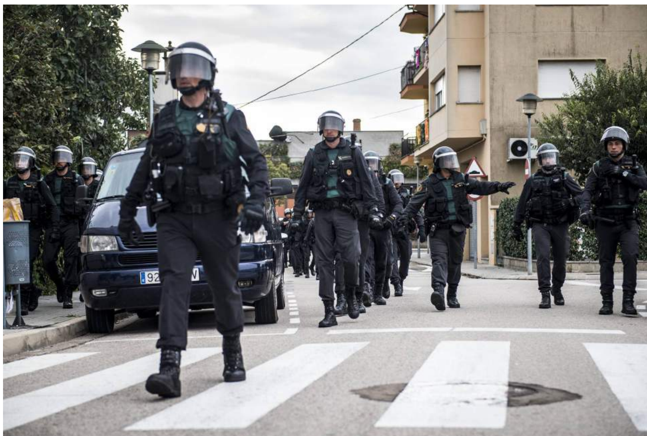
Agentes de la Guardia Civil, durante el dispositivo para impedir el referéndum ilegal del 1 de octubre.

Unos 3.000 guardias civiles y policías, que estuvieron desplegados en comisión de servicio en Cataluña con motivo de la celebración del referéndum ilegal del 1 de octubre y las posteriores elecciones autonómicas del 21 de diciembre, han presentado reclamaciones salariales por considerarse discriminados, según el Gabinete Jurídico Suárez-Valdés, que ha canalizado las demandas.