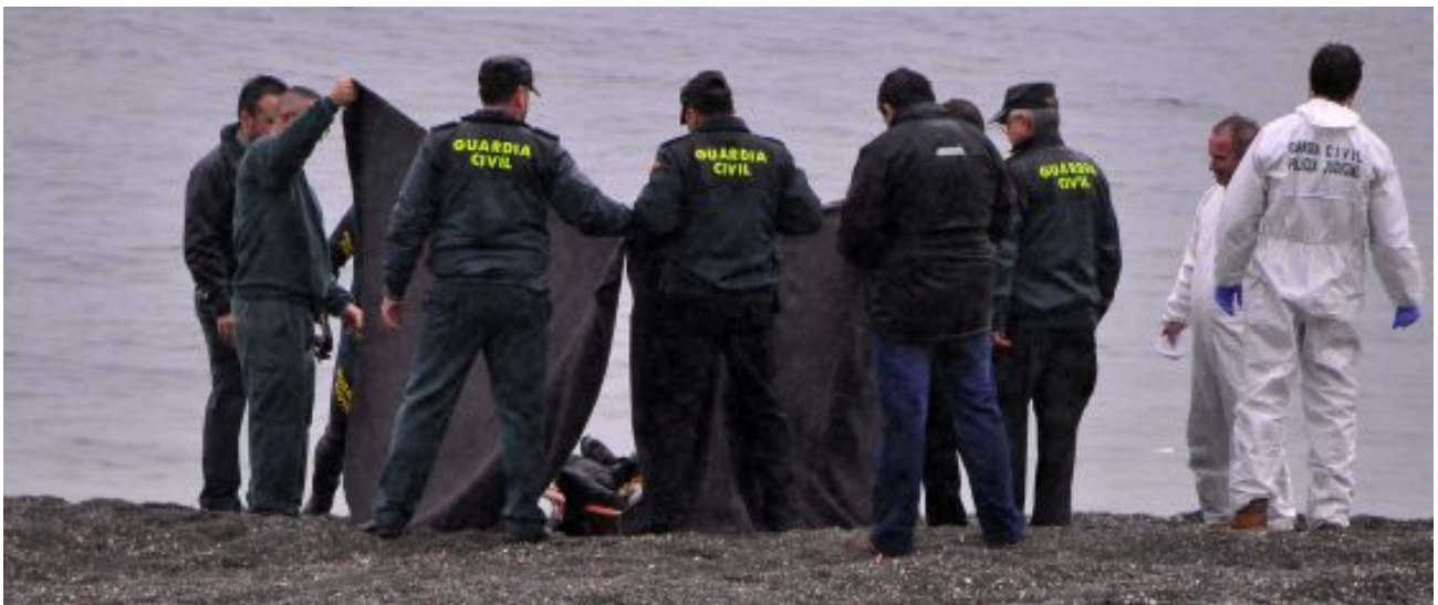
Guardias civiles recogen un cadáver en la playa del Tarajal.