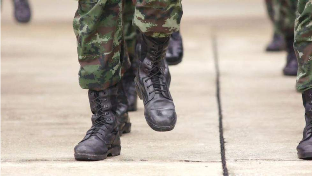
Soldados del Ejército de tierra desfilando.

En la compañía de Transmisiones la Brigada Canarias, con base en Las Palmas, le llamaban Vequia, traslación fonética de vieja en italiano. Cuando hacían marchas o estaban en formación, el sargento le gritaba: "¡Vequíá, ven aquí a la derecha de tu amo!" o "¡Vequia, ven a la derecha de papá!". Todos los soldados le reían la broma.