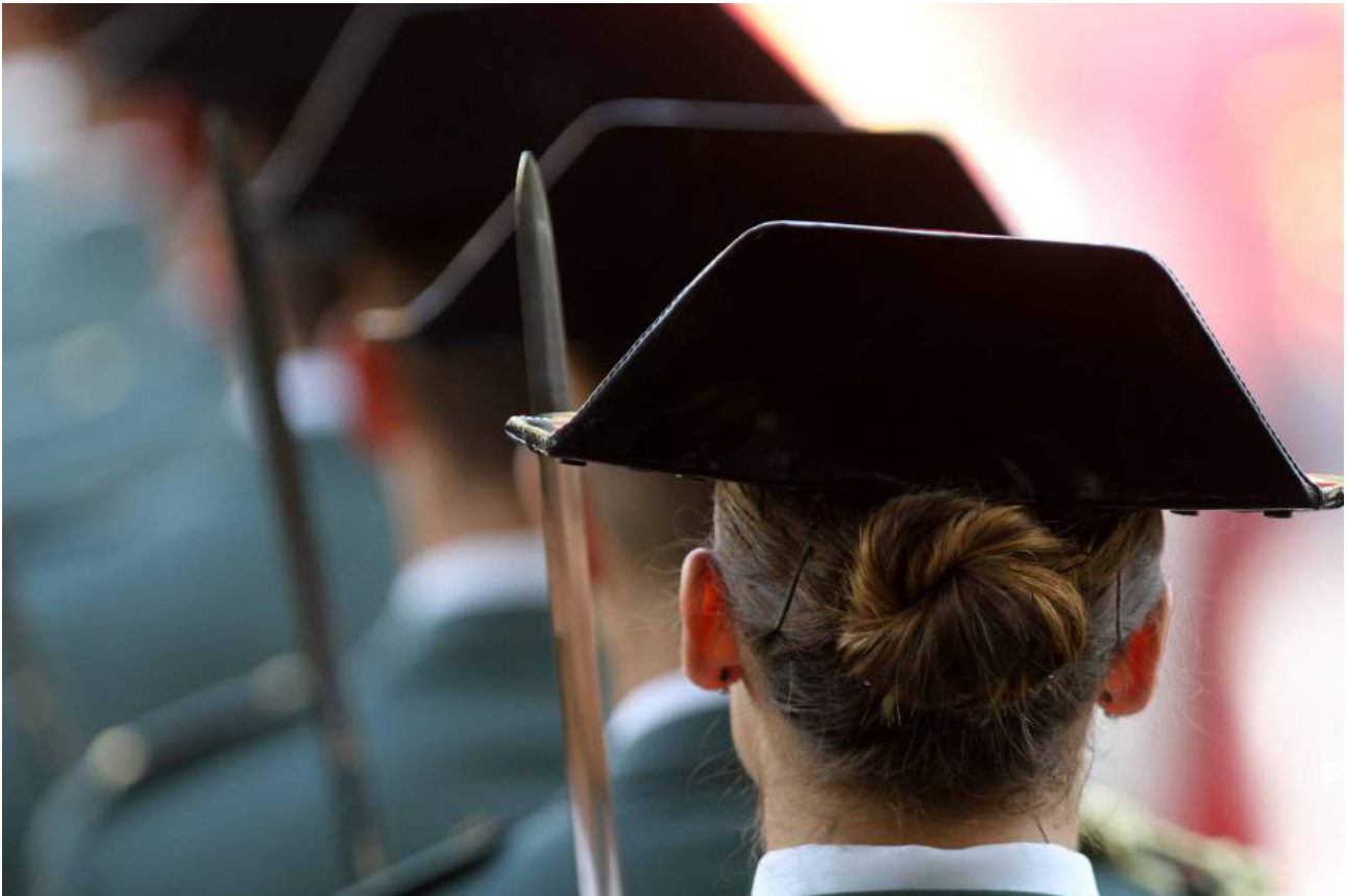
Acto de la Guardia Civil en Málaga.

Tener la regla, sobre todo si llega sin avisar y estando de servicio, puede costar muy caro a una guardia civil. En concreto, un expediente disciplinario por falta leve castigada con hasta dos días de suspensión de empleo y sueldo.