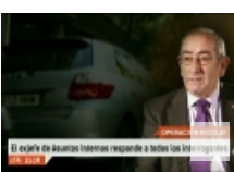
¿Por qué Asuntos Internos de la Pol ...