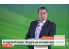
"No queremos que nos gobierne un pa ..."