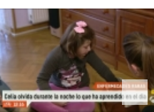
Celia olvida durante la noche lo qu ...