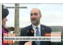
Investigan la muerte de un párroco ...