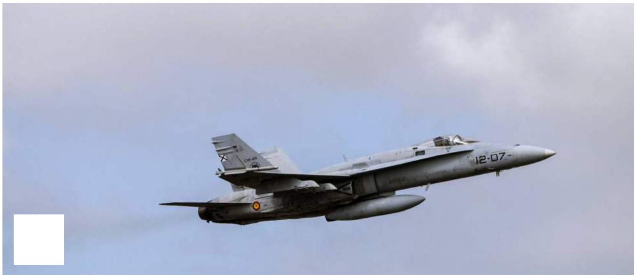
Un F-18 del Ejército despegando de la base canaria de Gando.