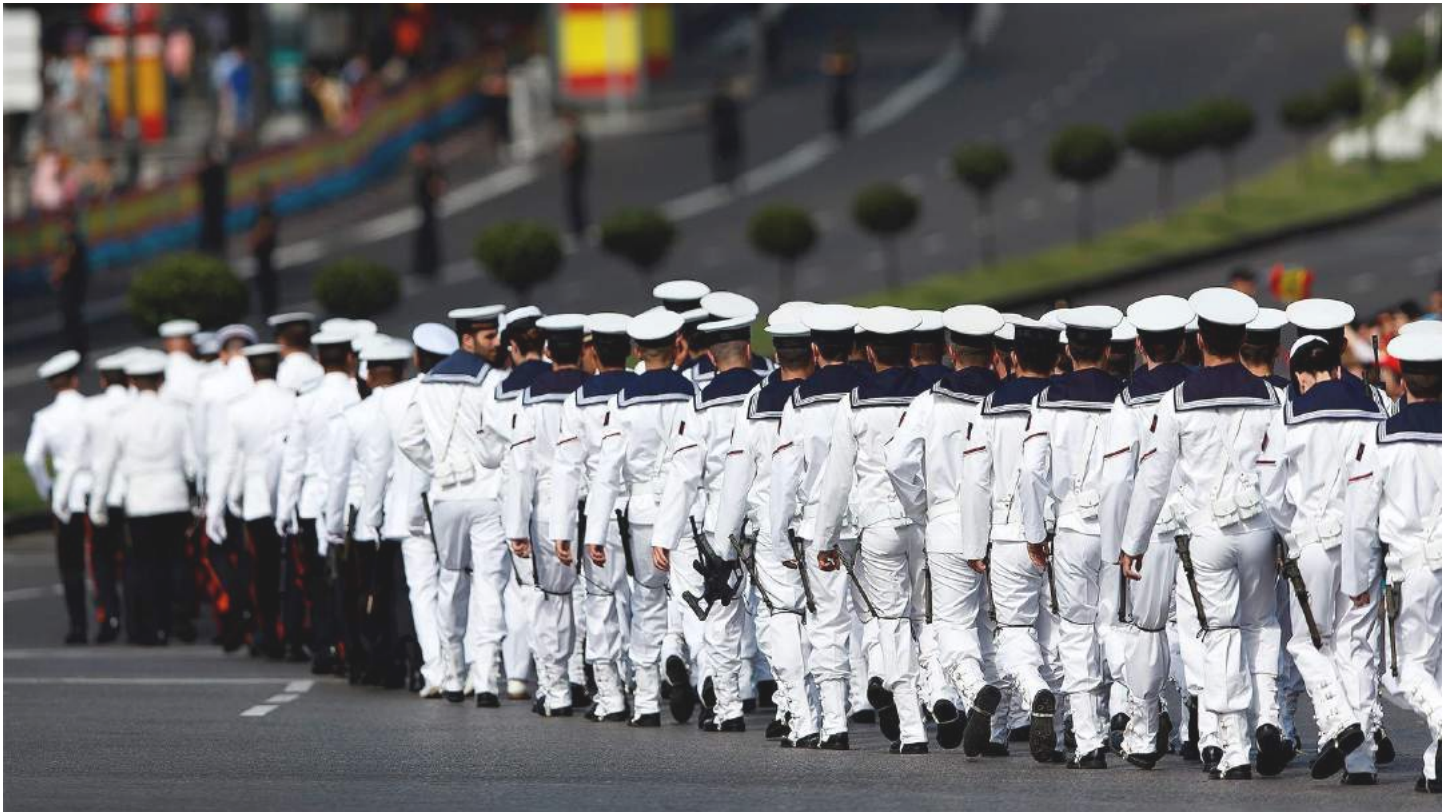
Un grupo de militares, el día de la coronación de Felipe VI en Madrid.

El nuevo Código Penal Militar sustituye al vigente, de hace 30 años, que no recogía delitos habituales.